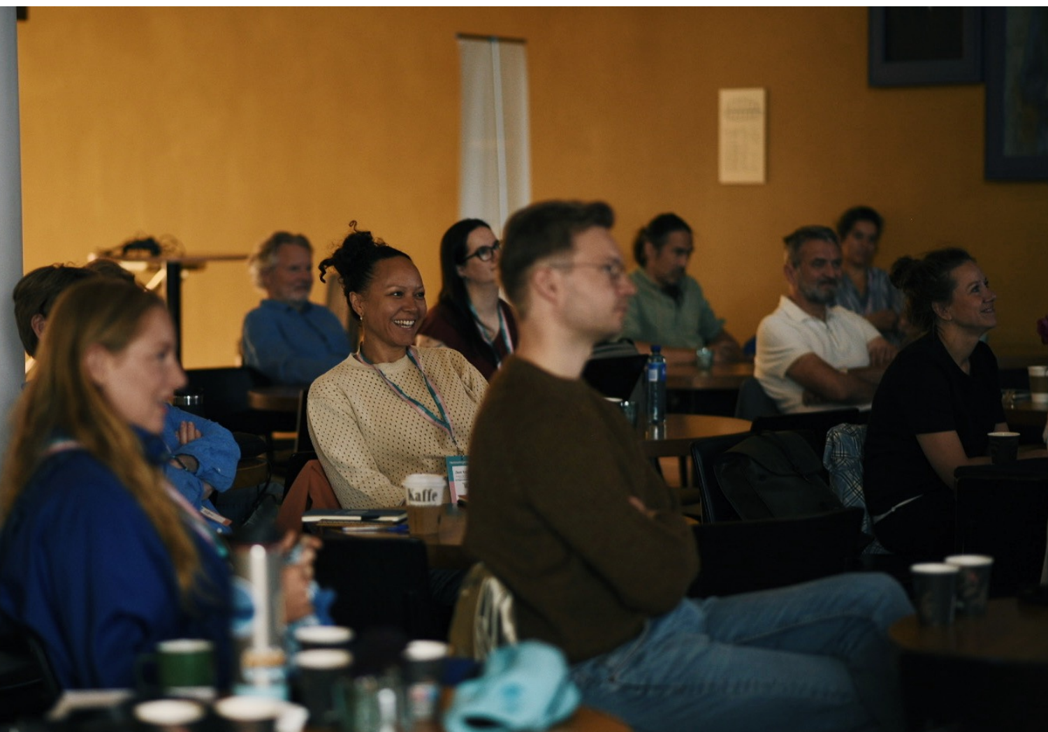
Bilde fra seminaret «Fremtidens arbeidsmarked», under Heddadagene 2024, arrangert i samarbeid med ELLIS; Et Langt Liv I Scenekunsten – et nettverk for erfaringsutveksling og kompetanse.

ELLIS er sammensatt av Norsk Skuespillersenter, Skuespiller- og danseralliansen, Creo, PRODA profesjonell dansetrening, Praxis Oslo og CODA Oslo International Dance Festival.